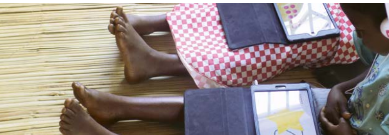
En Malawi, alumnos de educación primaria reciben clases adicionales con tabletas

Con motivo de la iniciativa especial «Formación y empleo» del BMZ, el KfW estableció en noviembre de 2019 el servicio «Inversiones para el empleo». En diciembre de 2019 se abonaron los primeros fondos en efectivo del BMZ, por valor de casi 98 millones de euros, que deberán alcanzar los 400 millones a medio plazo. En los seis países asociados de reforma del BMZ, así como en Ruanda y en Egipto (incorporación prevista) se financiarán inversiones para fomentar el empleo mediante rondas de competición. En total, con esta iniciativa especial deberán crearse hasta 100.000 puestos de trabajo y 30.000 plazas de formación.